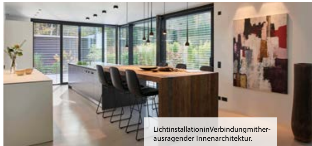
Lichtinstallation in Verbindung mit herausragender Innenarchitektur.