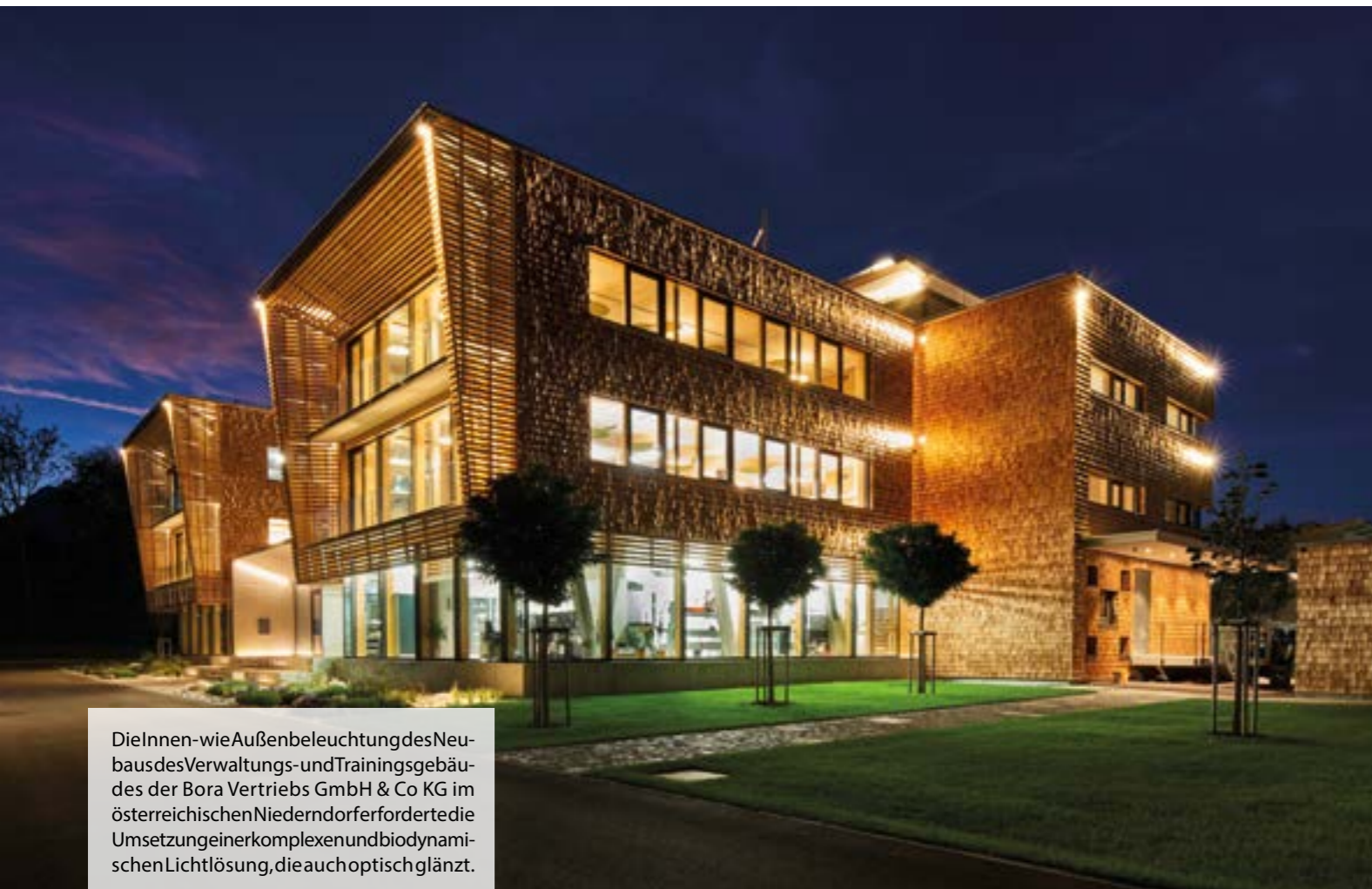
DieInnen- wie Außenbeleuchtung des Neubaus des Verwaltungs- und Trainingsgebäudes der Bora Vertriebs GmbH & Co KG im österreichischen Niederdorfer forderte die Umsetzung einer komplexen und biodynamischen Lichtlösung, die auch optisch glänzt.